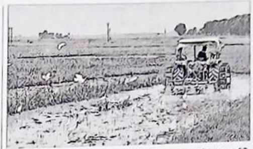
চাষের প্রস্তুতি... চাষের প্রস্তুতি... চাষের প্রস্তুতি...

০৫ন বিশেষ পুলিশ সার্কেলে অভিযানে পাচারের ছক ভেঙে ২০ কেজি গাঁজা-সহ চার যুবক গ্রেফতার করা হয়েছে।