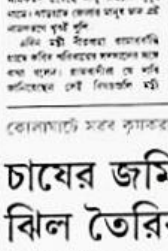
চাষের জমিতে বেআইনি মাছের বিল তৈরির অভিযোগ, ফ্লোভ