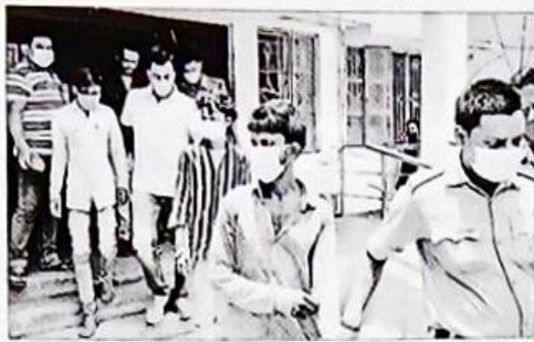
গ্রেফতার হার পাঁচ শাবরসহ চার যুবক।

০৫ন বিশেষ পুলিশ সার্কেলে অভিযানে পাচারের ছক ভেঙে ২০ কেজি গাঁজা-সহ চার যুবক গ্রেফতার করা হয়েছে।