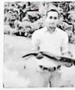
পাঙ্গাস মাছের কৃত্রিম প্রজননে উৎপাদন বাড়তে জোর